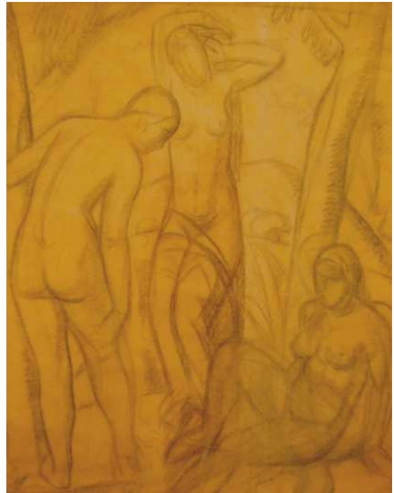
ESTUDIO PARA 'LAS BAÑISTAS'

CARBONCILLO / PAPEL 67 x 45 CM. HACIA 1915 - 20 SIN FIRMA. HACIA 1930 PROCEDENCIA: ESTUDIO DEL ARTISTA