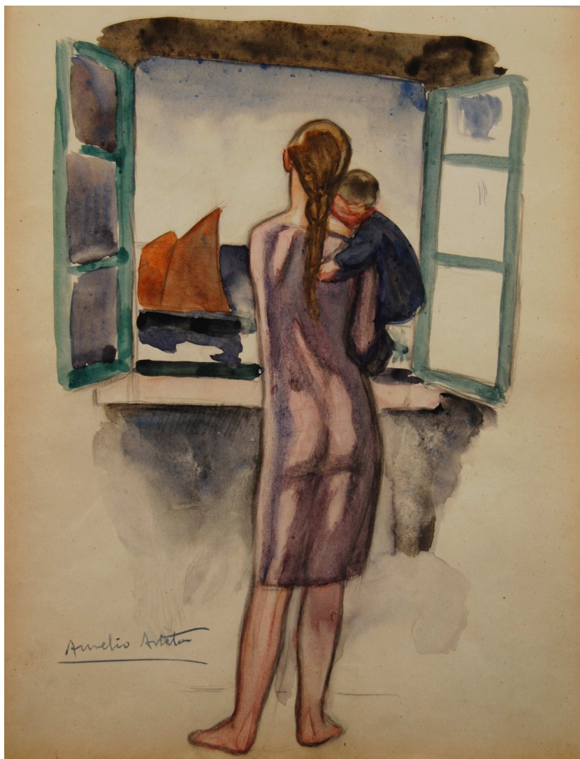
EN LA VENTANA

ACUARELA y lápiz / papel 27 x 21 cm. FIRMADO. C. 1920 - 25