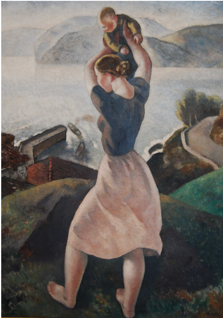
Despedida de los BARCOS

ÓLEO / LIENZO 123 x 89 CM. FIRMADO. HACIA 1933