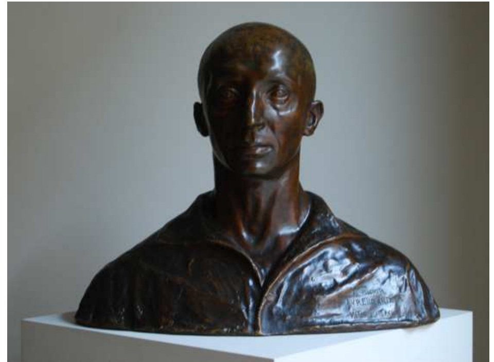
VICTORIO MACHO: BUSTO DE AURELIO ARTETA

Carboncillo / papel 125 x 66,5 cm. Hacia 1930 Sin firma. C. 1930