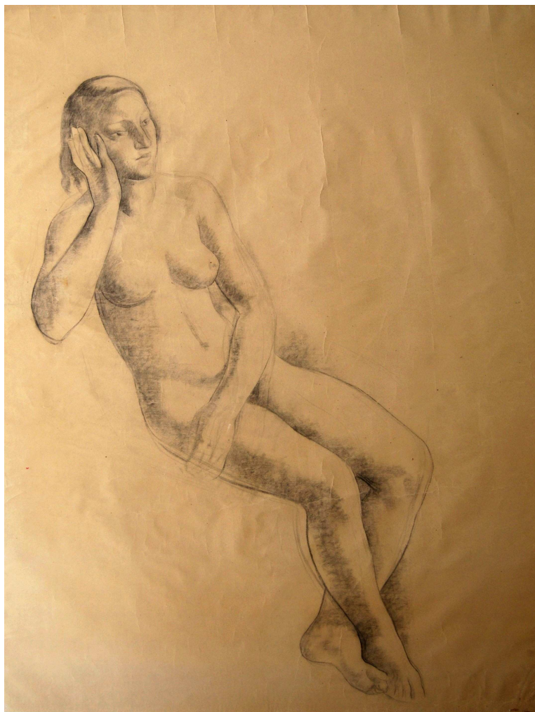
ESTUDIO PARA 'LAS BAÑISTAS'