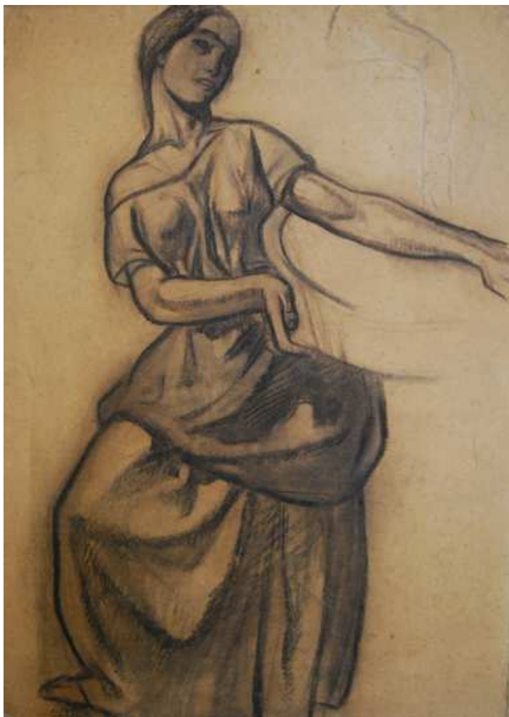
ESTUDIO PARA 'LA RECOLECCIÓN'