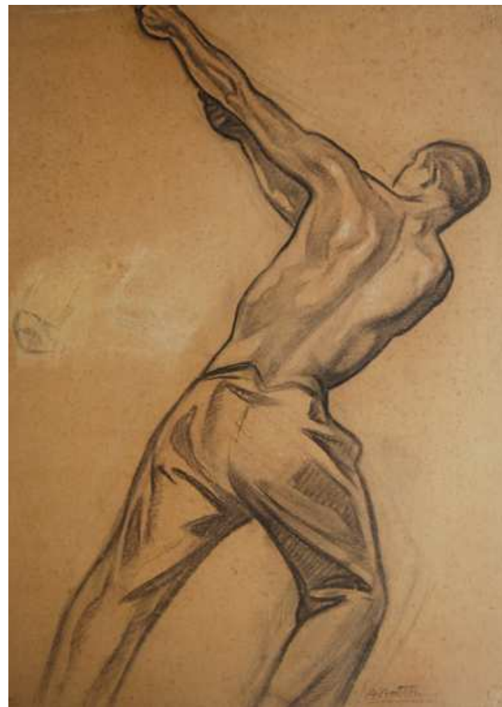
ESTUDIO PARA 'LOS DESCARGADORES'