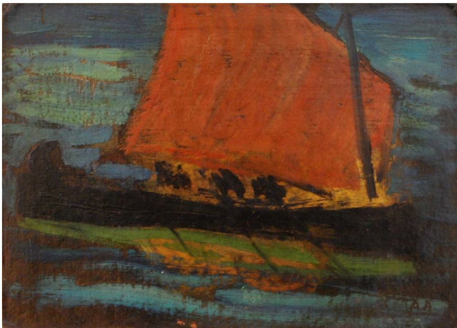
LANCHA DE PESCA