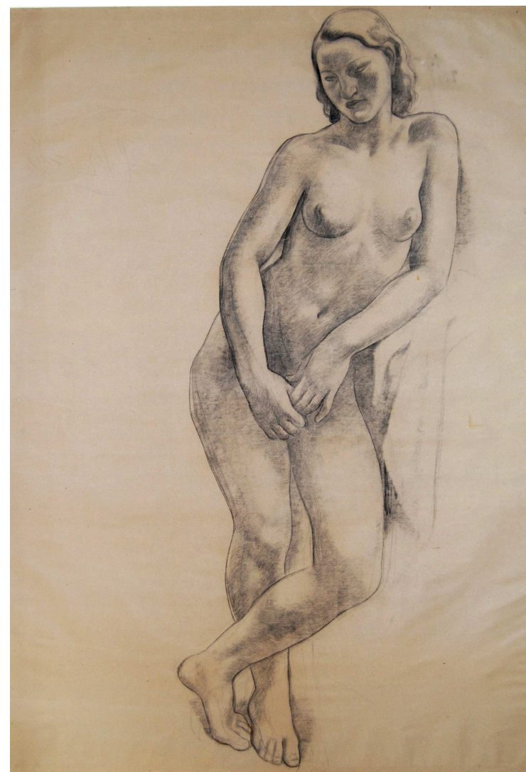
ESTUDIO PARA 'LAS BAÑISTAS'

ACUARELA y lápiz / papel 27 x 21 cm. FIRMADO. C. 1920 - 25