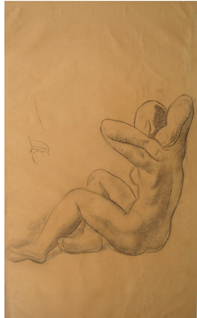
ESTUDIO PARA 'LAS BAÑISTAS'

ÓLEO / LIENZO 123 x 89 CM. FIRMADO. HACIA 1933