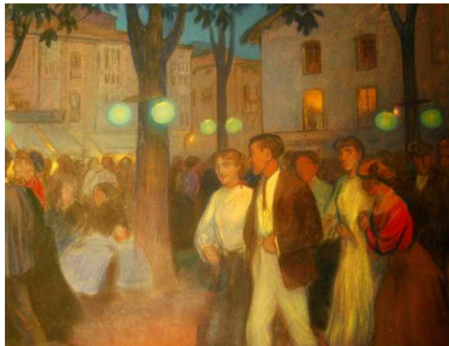
ROMERÍA EN DURANGO