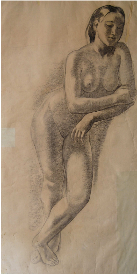
ESTUDIO PARA 'LAS BAÑISTAS'

Carboncillo / papel 125 x 66,5 cm. Hacia 1930 Sin firma. C. 1930